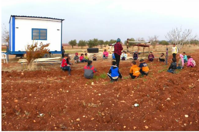
مشروع الكرفان 2015 © حسين الحسان