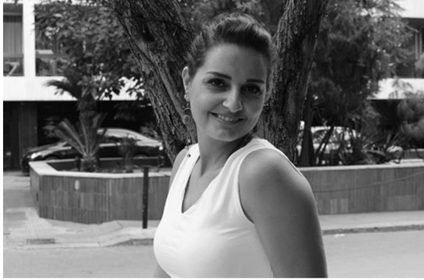
Dima Abo Zidan © Ettijahat