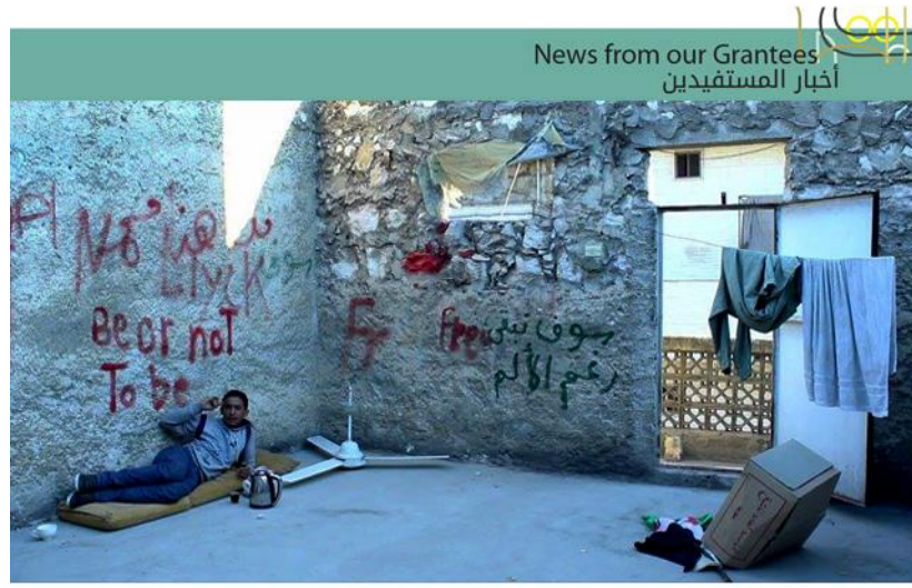
300 Miles © Orwa Mokdad