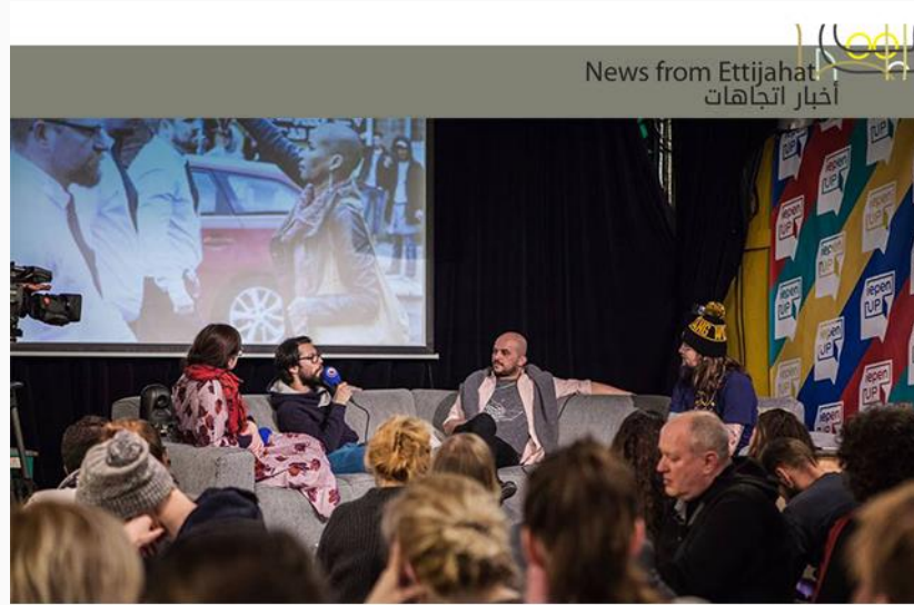
Borderlines Offensive Meeting