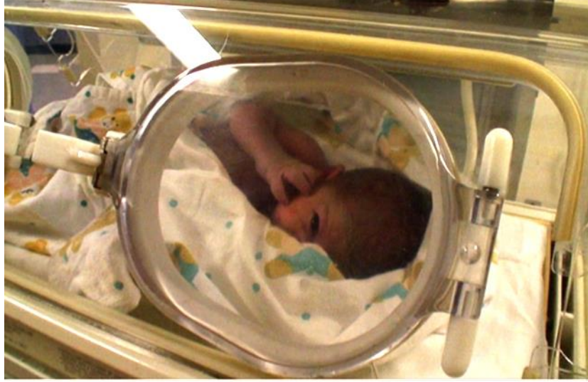
The Sun's Incubator © Ammar al Beik